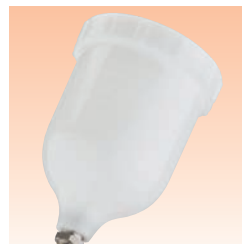
Tazza a gravità rif. GFC-501.