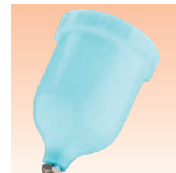
Tazza a gravità (poliestere blu) rif. GFC-511 per fluidi difficili.